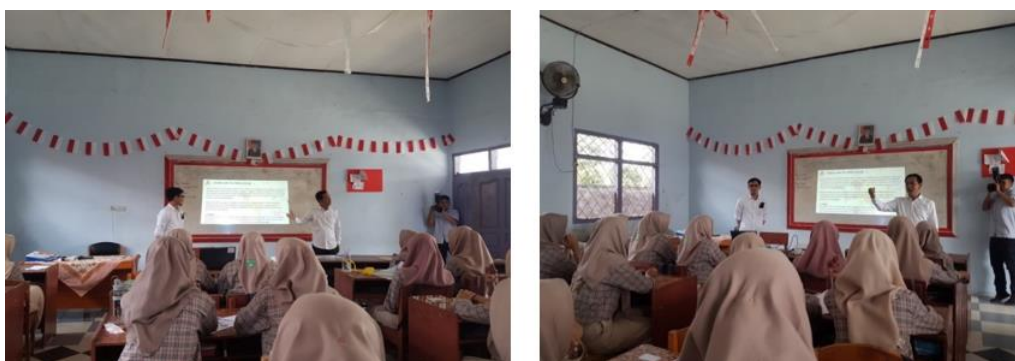
Gambar 2. Pemaparan Materi

dari awal hingga akhir acara, khususnya pada saat sesi diskusi. Diskusi berlangsung menarik karena banyak interaksi antara pemateri dengan peserta seputar sharing pengalaman, permasalahan hingga tanyajawab guna pendalaman materi.