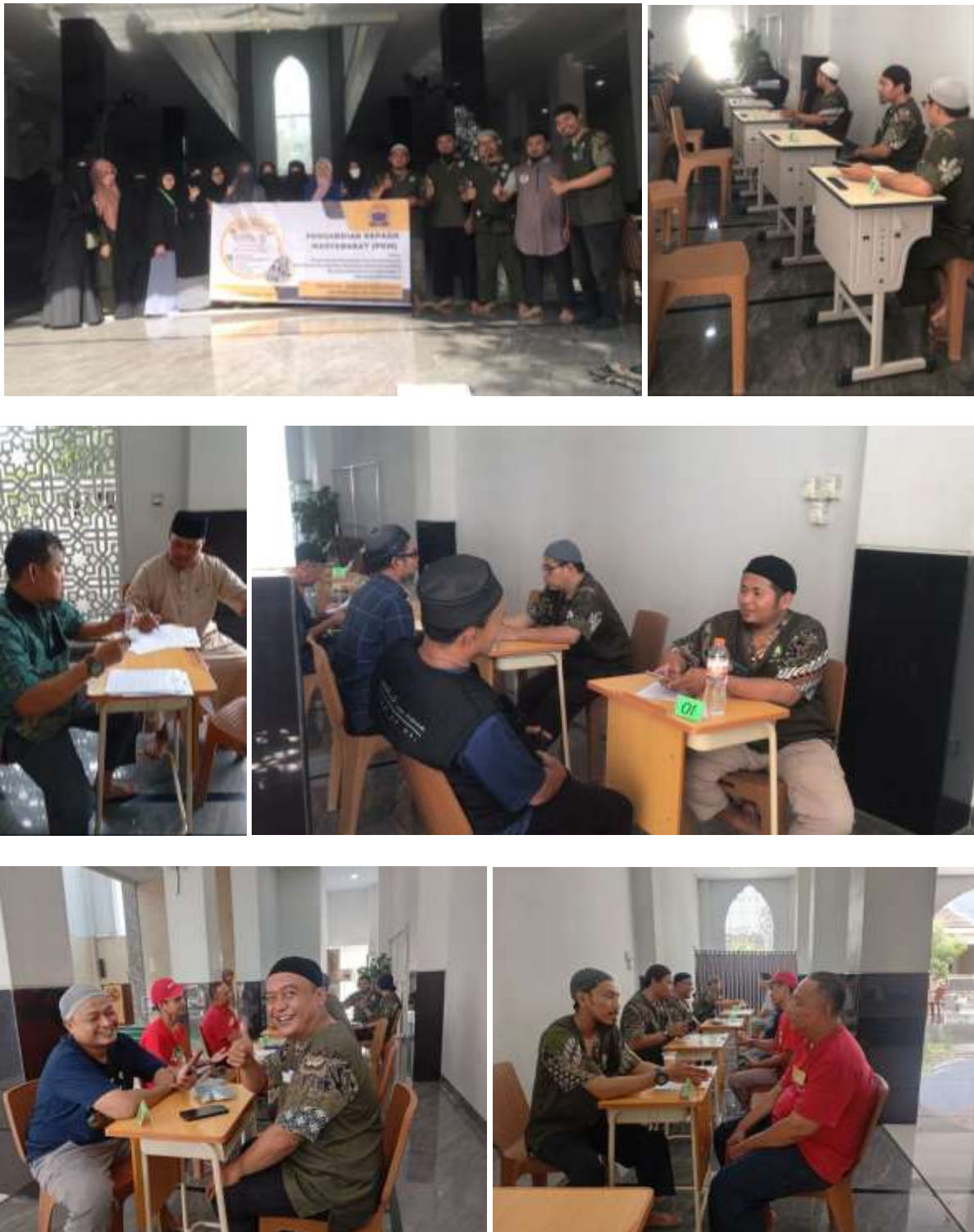
Gambar 3. Pelaksanaan PKM dalam Baksos Hatmas

Berikut dokumentasi pelaksanaan PKM pelaksanaan Baksos Hatmas yang dilaksanakan mulai dari tanggal 1, 8 & 15 November 2025 (setiap hari Sabtu – 3 pekan berturut-turut) :