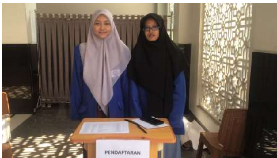
Gambar 1. Team PKM UPB pada Baksos Hatmas

Berikut PKM untuk mendukung pelaksanaan Baksos Hatmas yang dilaksanakan di Masjid Baitul Ikhlas yang bekerjasama dengan Team Ahli Kesehatan “Lugu Alami Klasik Indonesia (LP3IK)” asuhan dari Sinshe Abu Muhammad Faris Al-Qiyaji, yang dilaksanakan mulai dari tanggal 1, 8 & 15 November 2025 (setiap hari Sabtu – 3 pekan berturut-turut), PKM ini dapat membantu dengan baik pada proses pendaftaran pasien, form pendaftaran pasien, absensi pasien dan laporan pasien, serta didukung dengan aplikasi dripsender untuk mengingatkan pasien yang sudah pernah berobat sebelumnya dengan cara blash whatsapp pada gambar 2 berikut.