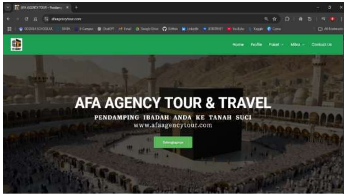
Gambar 1. Halaman Utama Website Afa Agency

dilakukan oleh team PKM Dosen dan Mahasiswa Fakultas Teknik Universitas Pelita Bangsa, kepada team AFA Agency.