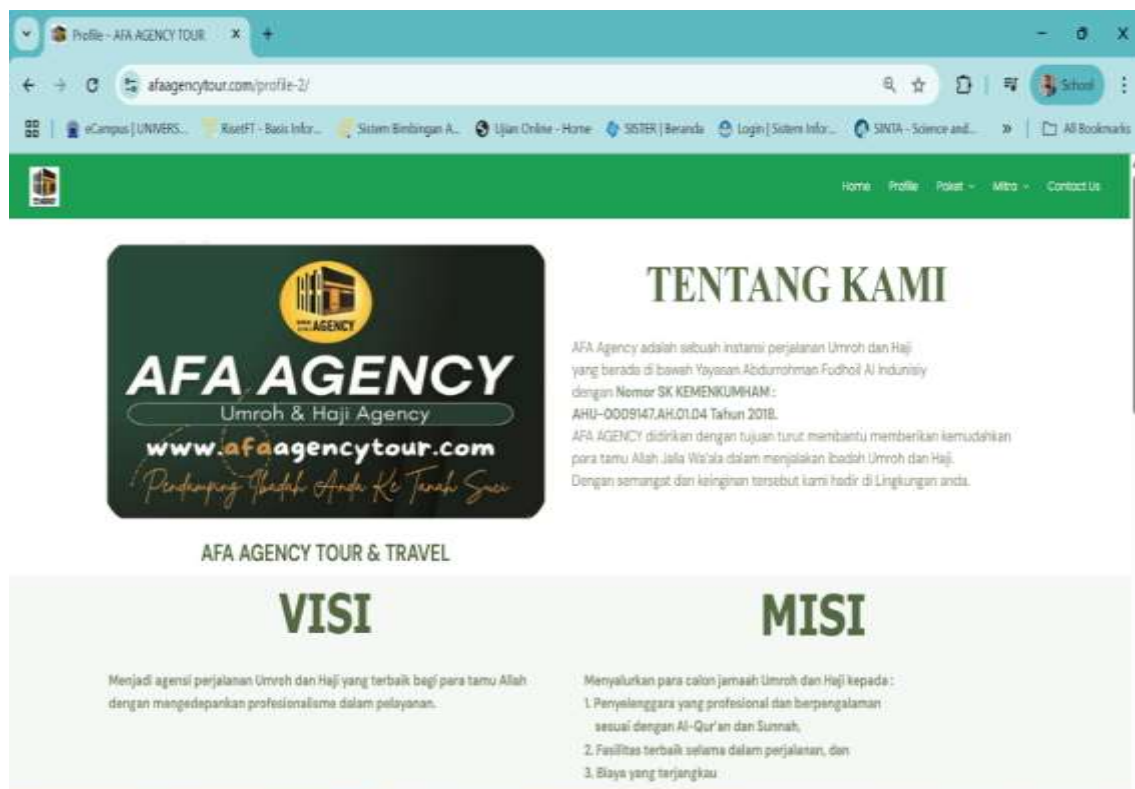
Gambar 2. Halaman Profil Afa Agency