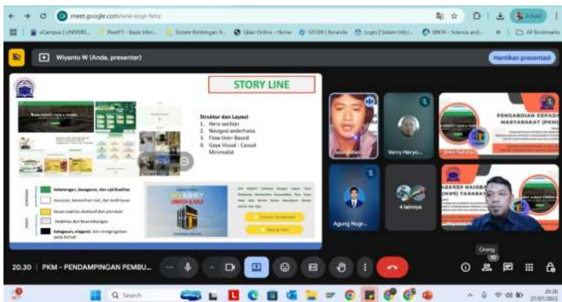
Gambar 4. Dokumentasi PKM

Dengan adanya pendampingan pembuatan website www.afaagencytour.com pada Afa Agency yaitu agen Umroh dan Haji menjadikan dapat menerapkan Visi Menjadi agen perjalanan Umroh dan Haji yang terbaik bagi para tamu Allah dengan mengedepankan profesionalisme dalam pelayanan dan Misi Menyalurkan para calon jamaah Umroh dan Haji kepada Penyelenggara yang profesional dan berpengalaman, sesuai dengan Al-Qur'an dan Sunnah, Fasilitas terbaik selama dalam perjalanan, dan Biaya yang terjangkau sehingga Afa Agency dapat terkenal di pelosok Nusantara. Dan untuk PKM selanjutnya akan membantu pendampingan pengelolaan website Afa Agency agar mandiri.