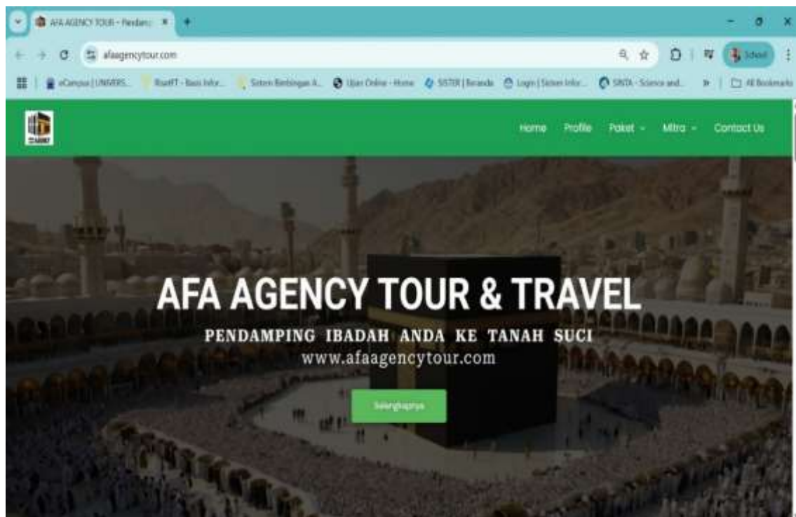
Gambar 1. Halaman Utama Website